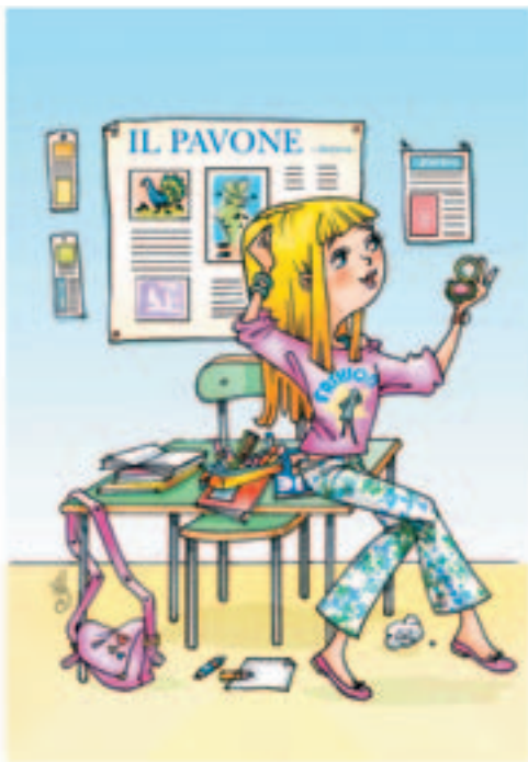
DESEGN: SIMONETTA POMPA

Appena ha un po' di tempo libero, si fionda nei negozi più «in» del centro a caccia di abiti e accessori ultimo grido.