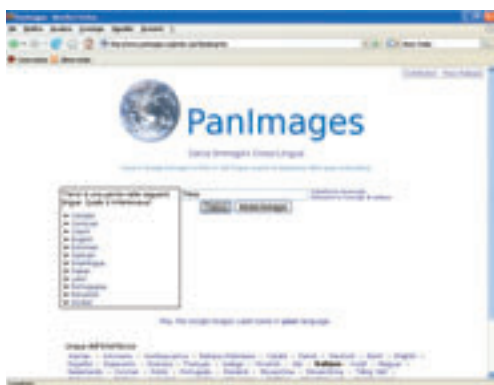
(fig.4) La ricerca con l'aiuto linguistico.