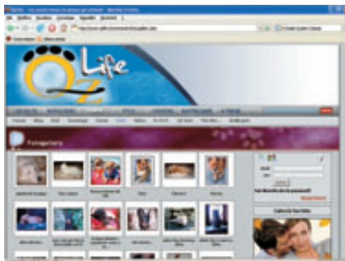
(fig.7) Fotogallery degli amici a quattro zampe.