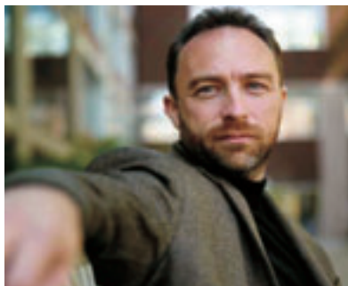
Jimmy Wales, l'ideatore di Wikipedia.

Jimmy Wales non riesce proprio a stare con le mani in mano. E dopo aver fondato Wikipedia , la popolare enciclopedia web, ha deciso di buttarsi nella mischia e sfidare nientemeno che Google, il motore di ricerca più cliccato del mondo.