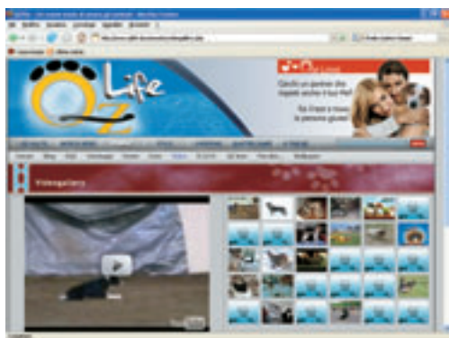
(fig.8) C'è anche la videogallery per vedere cani e gatti in azione.

clickare sul pulsante Ascolta RQZ per attivare la programmazione radio giornaliera fatta di musica da ascoltare con gli amici a quattro zampe. Tra un brano e l'altro, curiosità, notizie e consigli di veterinari ed esperti.