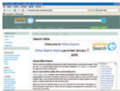
(fig.2) Pagina di benvenuto di Wikia Search.

Infine si potrà decidere se e quanto il risultato corrisponde a ciò che si stava cercando servendosi del sondaggio proposto dal motore, una scala di valutazione che prevede un punteggio da 1 a 5. I dati del sondaggio vengono elaborati dai computer di Wikia Search e serviranno ad offrire risultati sempre più precisi.