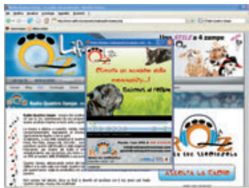
(fig.6) Come si presenta il sito Qzlife.

Basta collegarsi al sito http://www.qzlife.it/community/radioquattrozampe.php