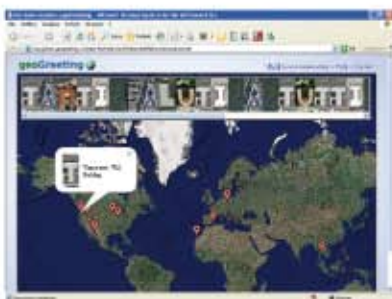
(fig.8) Il messaggio è stato recapitato.

Infine inseriamo in To name , il nome del nostro amico, e in To email il suo indirizzo di posta. (fig. 7) Non resta che cliccare su Send It! e il gioco è fatto! Il messaggio verrà recapitato al nostro amico di penna in pochi secondi. (fig. 8) Il divertimento e la sorpresa sono garantiti!