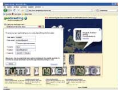
(fig.7) Il form con i dati da inserire.

compiliamo il modulo inserendo in From Name il nostro nome e in From email il nostro indirizzo mail.