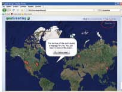
(fig.5) Videata d'introduzione per Geogreeting.

Per rimanere in contatto con i nostri amici di penna, oggi esistono moltissime possibilità sul web: la classica mail, la chat, l'Instant messaging . Peccato che siano tutte così... noiose! È vero, nella chat possiamo usare le chat icon (le faccine) ma dopo qualche chiacchierata on line, le solite quattro icone ci vanno un po' strette.