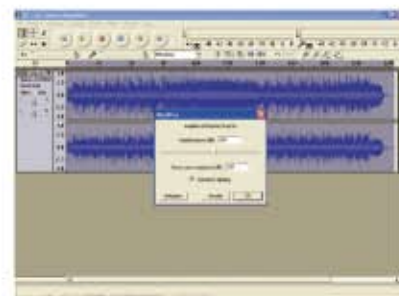
(fig.4) Qui come appare al momento delle modifiche del file.