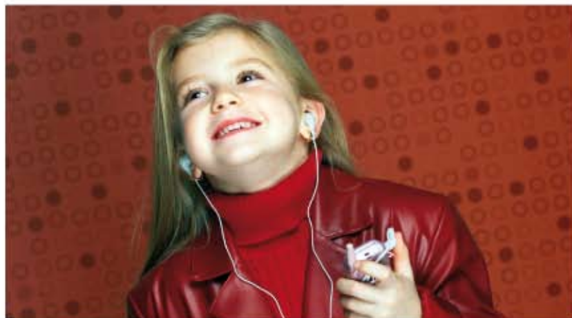
Con il programma Audacity migliora la qualità degli mp3.

Infine inseriamo in To name , il nome del nostro amico, e in To email il suo indirizzo di posta. (fig. 7) Non resta che cliccare su Send It! e il gioco è fatto! Il messaggio verrà recapitato al nostro amico di penna in pochi secondi. (fig. 8) Il divertimento e la sorpresa sono garantiti!