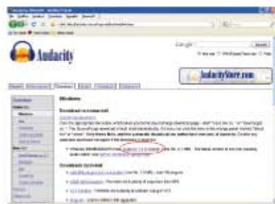
(fig.2) Pagina per installare Audacity.

I file mp3 sono una bella risorsa: permettono di ridurre lo spazio su disco delle