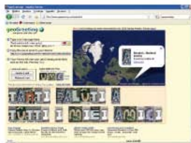
(fig.6) Il messaggio in anteprima da inviare.

compiliamo il modulo inserendo in From Name il nostro nome e in From email il nostro indirizzo mail.