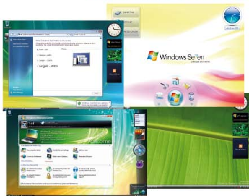
(fig.1) Alcune videate del nuovo sistema Windows 7.

Windows Vista è stato un flop, ma alla Microsoft sono corsi subito ai ripari. E stanno per lanciare un nuovo sistema che promette meraviglie.