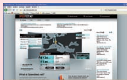
fig. 3 Finestra per selezionare un riepilogo delle prove effettuate.

fai click sul pulsante blu Copy Direct Link (fig. 3) che trovi nella parte bassa della pagina: otterrai il collegamento ad un'immagine di riepilogo che contiene i risultati delle prove effettuate.