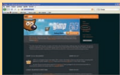
fig. 4 Videata che permette di fare il download di Gimp.

se (rumore digitale). Inoltre può aprire numerosi formati come BITMAP, JPEG, PNG, GIF e TIFF, insieme ad altri meno diffusi come le immagini di Paintshop Pro e documenti di Adobe Photoshop. Gimp può importare (ma non salvare) file PDF e immagini RAW, usato da molte fotocamere digitali.