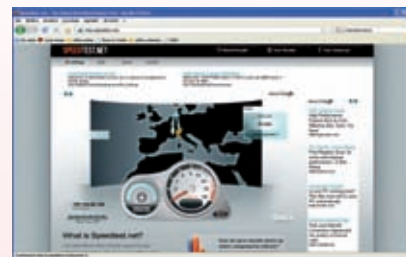
fig. 2 Finestra per visualizzare le analisi della linea telefonica.

Speed test inizierà dopo pochi secondi l'analisi della linea telefonica. (fig. 2) Al termine potrai vedere i risultati alle voci Download e Upload . Infine,