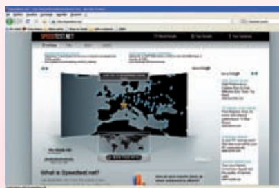
fig. 1 Videata con il pulsante Begin Test .

Per scoprire se ci sono problemi e verificare la velocità della connessione ad Internet, oggi puoi utilizzare il servizio on line Speedtest , in grado di sottoporre la tua linea internet a severi test fornendoti, in una manciata di secondi, risultati estremamente dettagliati.