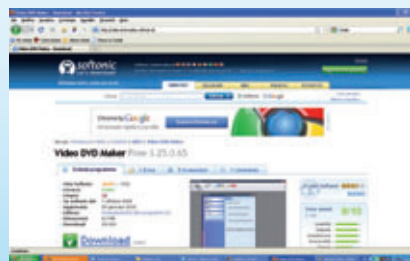
fig. 1 Videata per il download del programma.

Premiamo ancora Next e attendiamo che Dvd Maker converta i filmati in un formato compatibile per DVD. Una volta terminato il processo, non ci resta che inserire un cd o dvd nel masterizzatore del computer e premere il pulsante Burn , per creare il nostro disco da vedere e rivedere in tv.