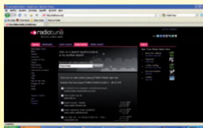
fig. 4 Videata per individuare le radio che stanno trasmettendo le canzoni del nostro cantante preferito.

Per la tua festa di compleanno è tutto pronto: giochi, dolci, bibite e qualche palloncino che mette subito allegria. E la musica? Non vorrai mica mettere le solite compilation di mp3! Ormai anche i muri di casa tua le sanno a memoria. Meglio sintonizzarsi su Radio Tuna , l'emittente web gratuita che ti permette di ricercare il tuo artista o genere preferito, scegliendo tra le centinaia di stazioni radio web del