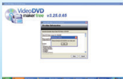
fig. 2 Finestra di richiesta per installare codec aggiuntivi.