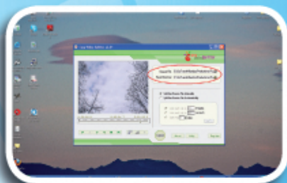
Fig. 5 - Schermata per salvare in una cartella il video diviso.