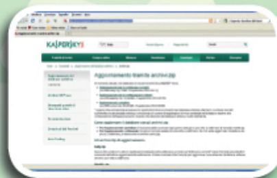
Fig. 3 - Videata per selezionare la pagina per scaricare l'antivirus di Kaspersky.