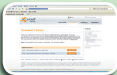
Fig. 2 - Pagina per scaricare la protezione contro i virus di Avast!