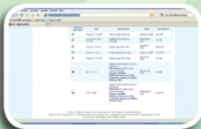
Fig. 1 - Videata per il download di AVG.

Infine, per chi usa Kaspersky , deve selezionare la pagina http://www.kaspersky.com/it/avupdates?chapter=146669701 e cliccare sulla voce Aggiornamento per la settimana corrente . (fig. 3)