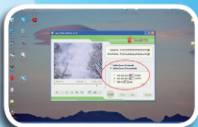
Fig. 6 - Pagina per scegliere la durata degli spezzoni del video.